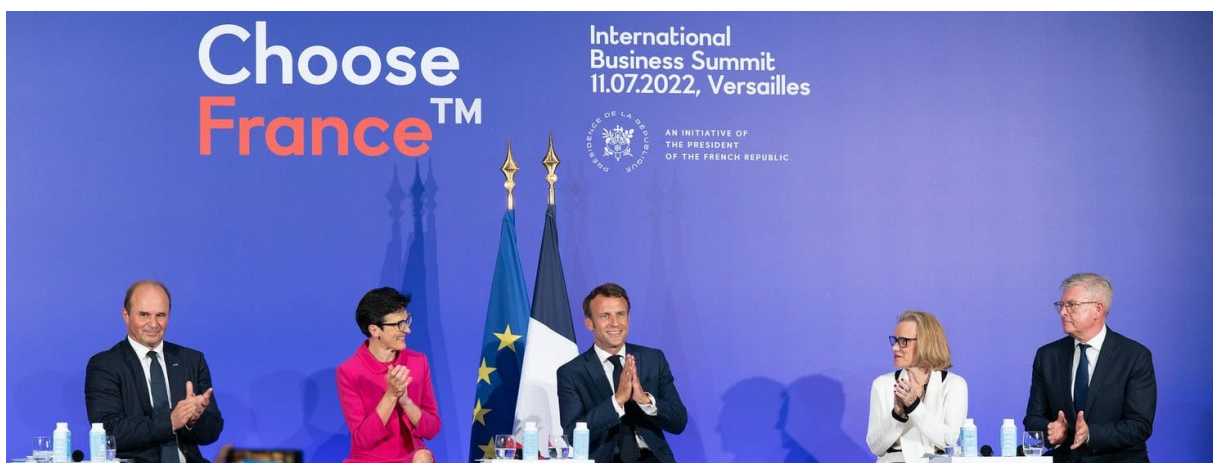
Figuur 2: https://www.elysee.fr/emmanuel-macron/2022/07/11/choose-france-5eme-edition-attractivite-investissements-et-rangers