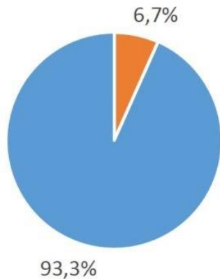
Aantal apotheken naar herkomst van het kapitaal. Gegevens voor 02/2020.